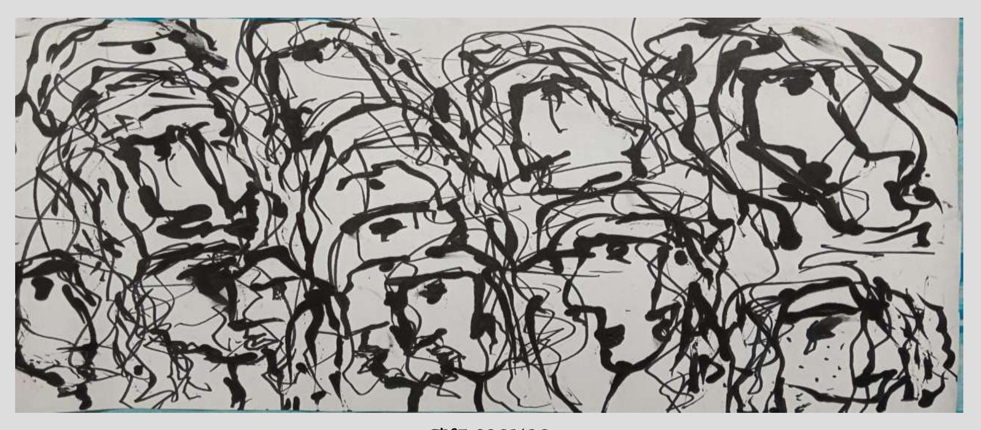
THE COSMOS NEWS LETTER OF THE DEPARTMENT OF PHILOSOPHYDURGAPUR GOVERNMENT COLLEGE

GREETINGS FROM THE HEAD OF THE DEAPRTMENT