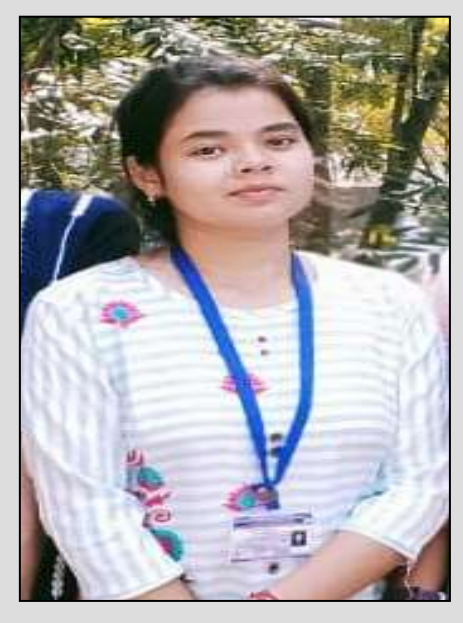
THE COSMOS NEWS LETTER OF THE DEPARTMENT OF PHILOSOPHYDURGAPUR GOVERNMENT COLLEGE

their mental health. It was thought to be better to choose an environment where the toil of the day would be reduced and where naturally students would be more prone to feel free to talk. Reading the young minds would thus be easy since it is extremely important to know what a student is thinking or undergoing as a person amongst his/ her peer group. The Department felt that none of the students must be left out supposing him/her to be shy/introvert/slow/unequipped. Since such ignorance on the part of the Department may lead to consequences which may bring about massive effects which affect the environment of the class. It was heavily felt that students should be inspired and made ready. It is easy to groom a fast learner but perhaps it is more self-fulfilling for the Department to groom and make a slow/ shy student equipped by showing a bit of intellectual empathy